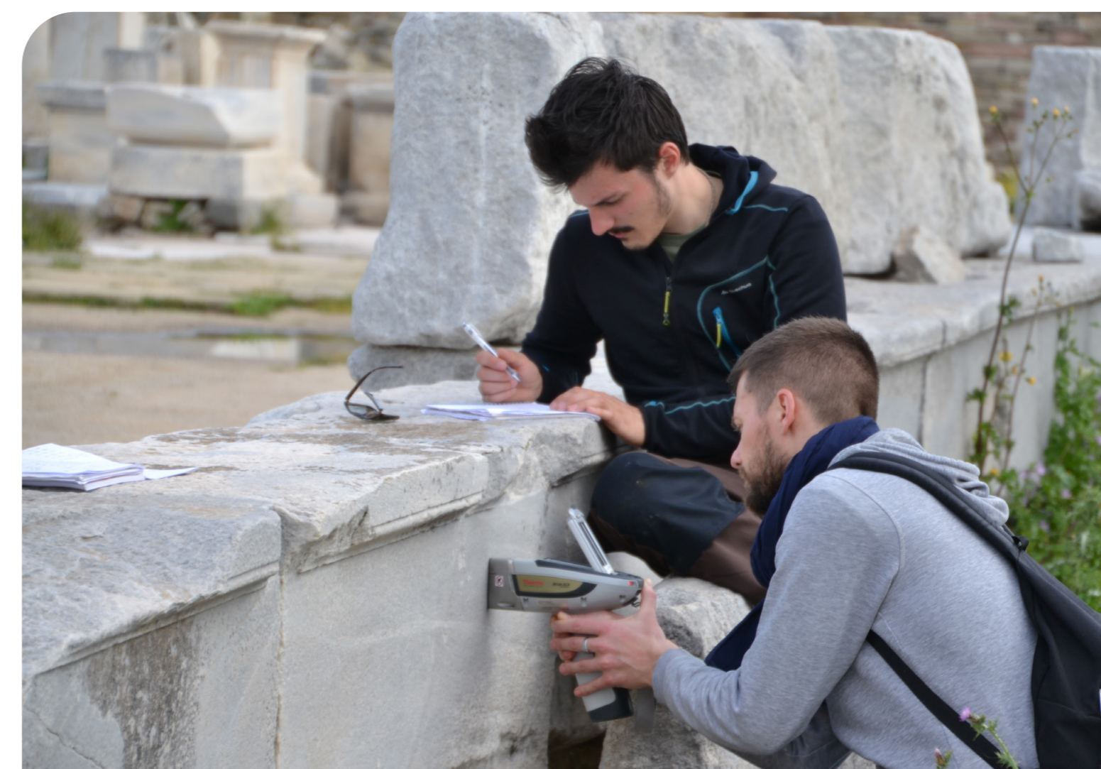
Analyse de marbre au spectromètre XRF portable.

Le projet porté par l'IRAA a rassemblé des archéologues, des architectes, des historiens et des géologues. Les partenaires de l'IRAA ont été l'Institut de Minéralogie, de Physique des Matériaux et de Cosmochimie, l'Institut des Sciences de la Terre de Paris, le Centre Alexandre-Koyré et l'École Française d'Athènes.