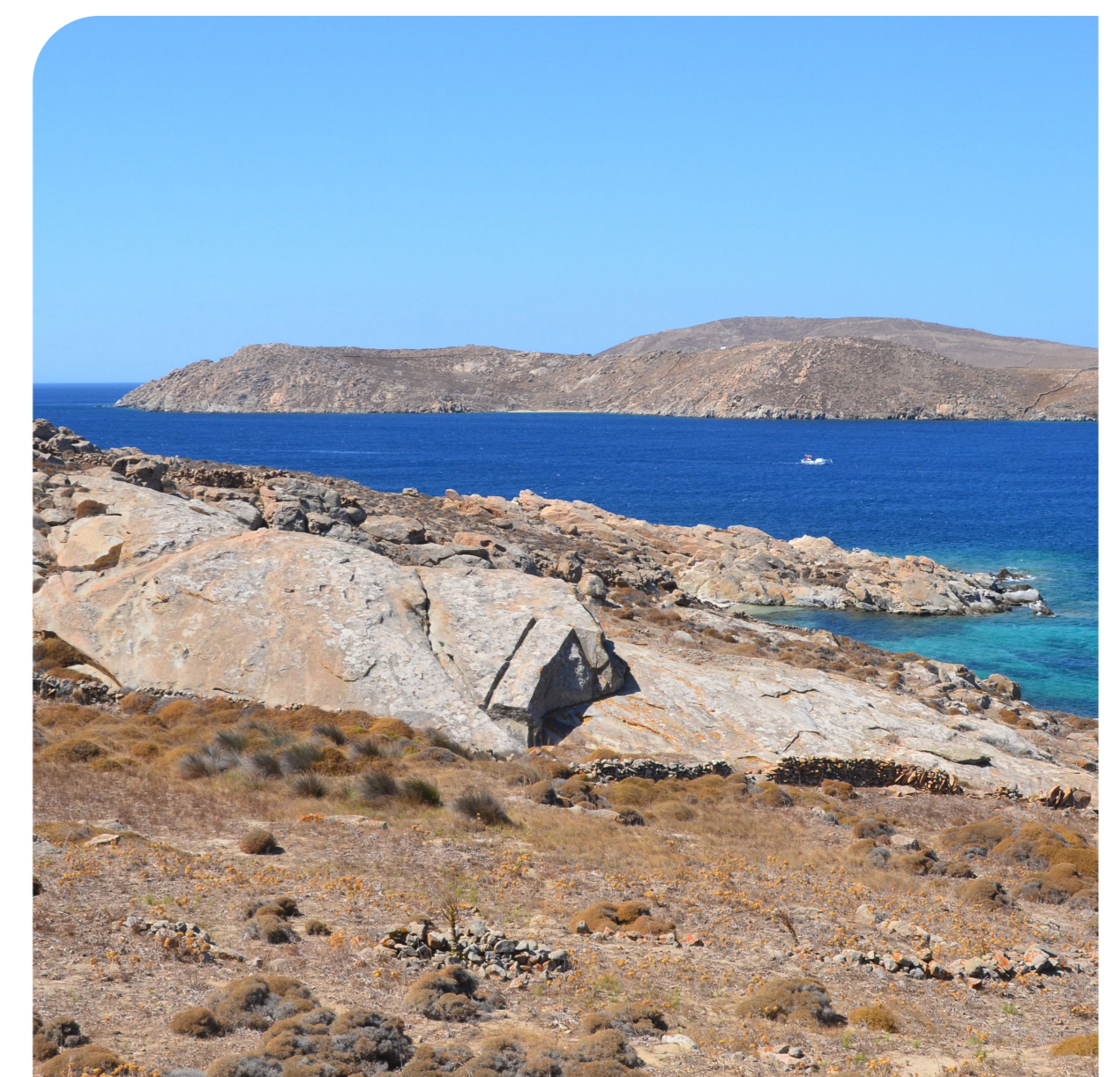
Une carrière de granite.

Il s'agissait de comprendre avec quels matériaux locaux ou importés s'est développée entre le VIIe et le Ier av. J.-C. une ville de taille moyenne sur une île de surface très réduite. Comment ses habitants et les étrangers qui ont construit dans l'île ont combiné, et selon quels critères de choix, des roches extraites dans les carrières locales et d'autres qu'ils ont importées.