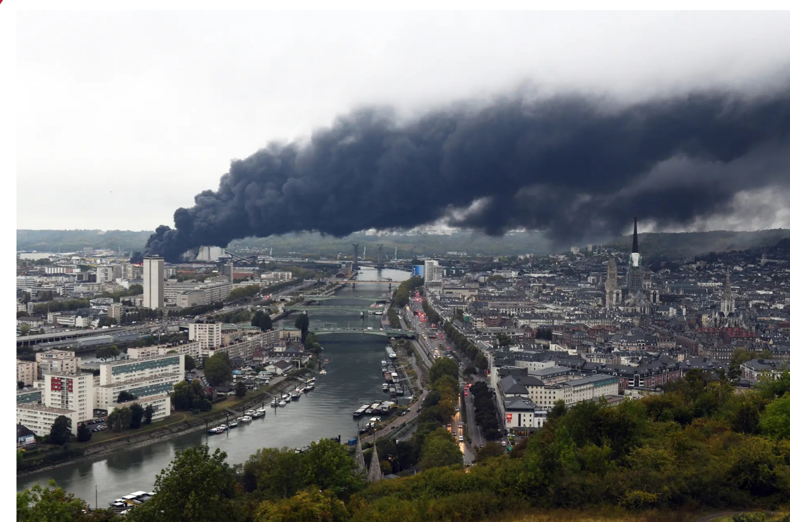
Nuage de l'incendie survolant Rouen le 26 septembre 2019.