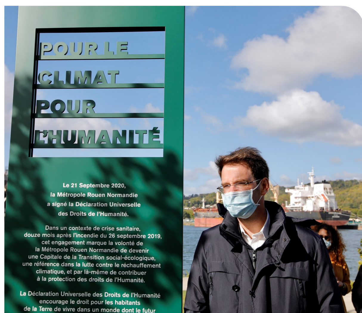
Inauguration de la stèle «Pour le Climat - Pour l'Humanité» par le nouveau président social-écologiste de la Métropole Rouen Normandie, le 26 septembre 2020.

Cette étude sur les métropoles écologistes menée par l'UMR CNRS 6266 IDEES s'inscrit dans le cadre du programme multidisciplinaire Copherl, porté par l'Université de Rouen Normandie et financé par la Région Normandie suite aux incendies survenus à Rouen le 26 septembre 2019. Elle vise à mobiliser l'apport des sciences sociales au service de l'analyse des politiques publiques de transition.