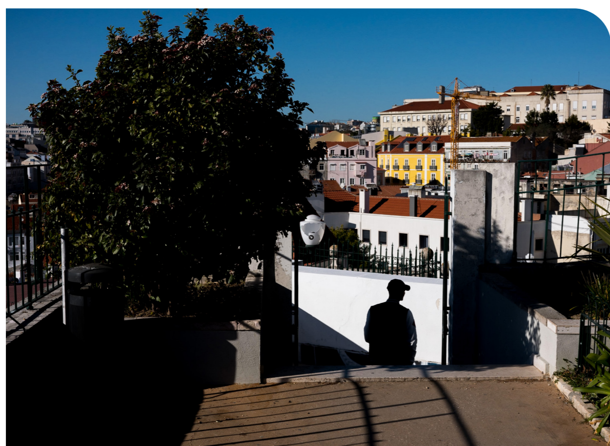
Photographie réalisée au cours de l'ethnographie visuelle menée dans le quartier, plus précisément au Jardim do Torel.