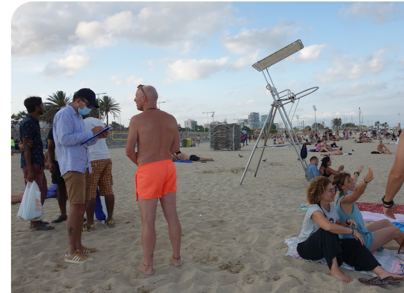
Distribution d'un questionnaire sur la plage de Bogatell, Barcelone, 15-07 2020

Les plages des grandes villes sont le théâtre de multiples pressions (érosion, rejets divers, fortes fréquentations, intérêts économiques), ce qui questionne leur gestion par les pouvoirs publics. En écho aux lignes directrices de la GIZC qui recommandent d'adopter une approche systémique, ce travail propose une analyse des politiques publiques de gestion mises en œuvre sur les plages de Marseille, Barcelone et Valence en prenant la gestion intégrée comme cadre de référence.