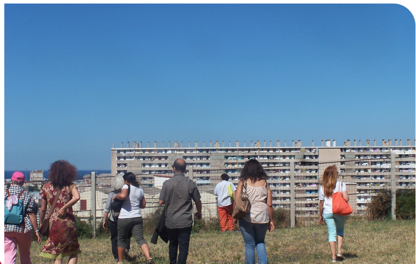
Photographie d'un groupe en balade dans les quartiers nord de Marseille via Hôtel du Nord - Crédit : Yannick Hascoët

La recherche est résolument tournée vers la « communauté patrimoniale » (Faro, 2005) Hôtel du Nord, qui développe depuis une décennie une offre d'hospitalité (balades, hébergements) dans la métropole. Hôtel du Nord est au fondement d'une plateforme d'hospitalité déployée à l'échelle européenne, Les Oiseaux de passage, qui rassemble des acteurs issus du tourisme, de la culture, de l'ESS, de l'éducation populaire, du développement local et du monde coopératif.