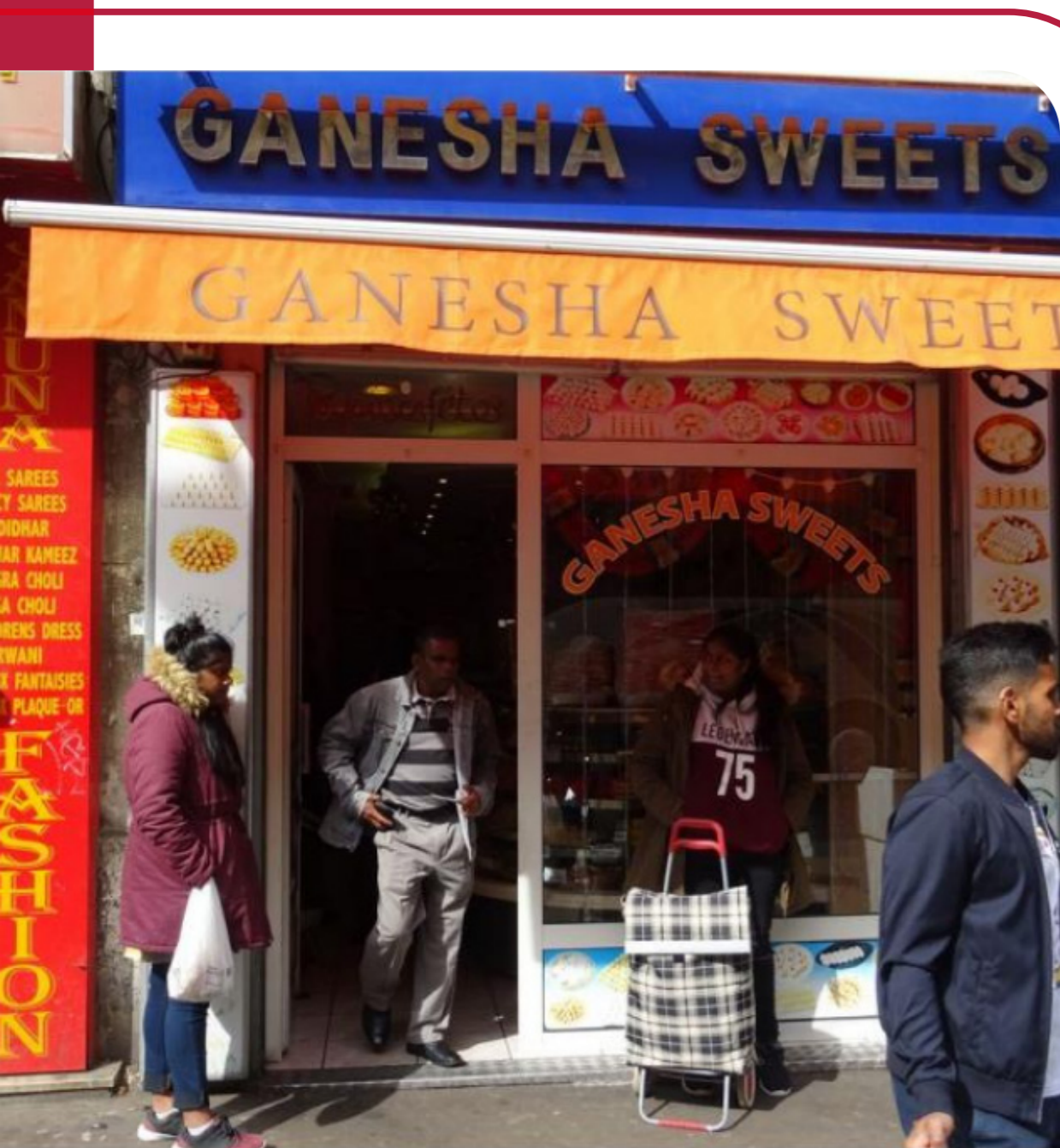
Visuel de promotion d'une balade offerte par Seine-Saint-Denis Tourisme visant la découverte de « la culture indienne à Paris » - Crédit : Yannick Hascoët - matériel d'enquête

A l'aval d'un terrain doctoral (2016), un questionnement général sur la mobilisation de savoirs sociaux en contexte récréatif et un terrain périodiquement chroniqué : les quartiers nord de Marseille, territoire de « balades urbaines »