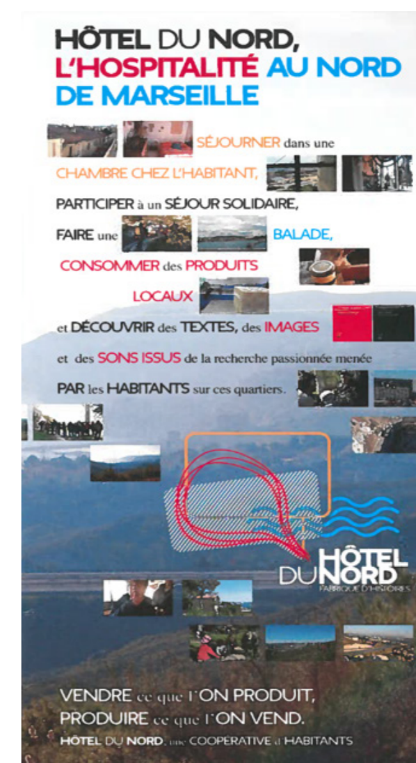
Flyer promotionnel diffusé par Hôtel du Nord