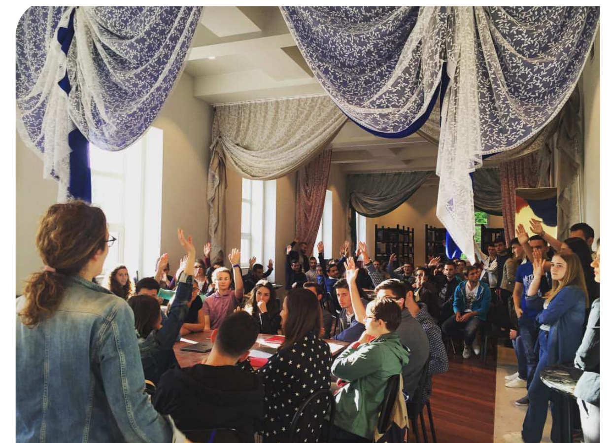
COD Tirana, 2016

Les possibilités offertes par cette interprétation différente de l'espace pour les pratiques liées aux sites de patrimoine culturel et de monuments urbains sont examinées par le biais d'un travail commun. La tentative de répondre à un ensemble de questions provenant de différents acteurs est basée sur le triangle théorique reliant la géopolitique critique, le travail For Space de Doreen Massey et les études critiques de patrimoine.