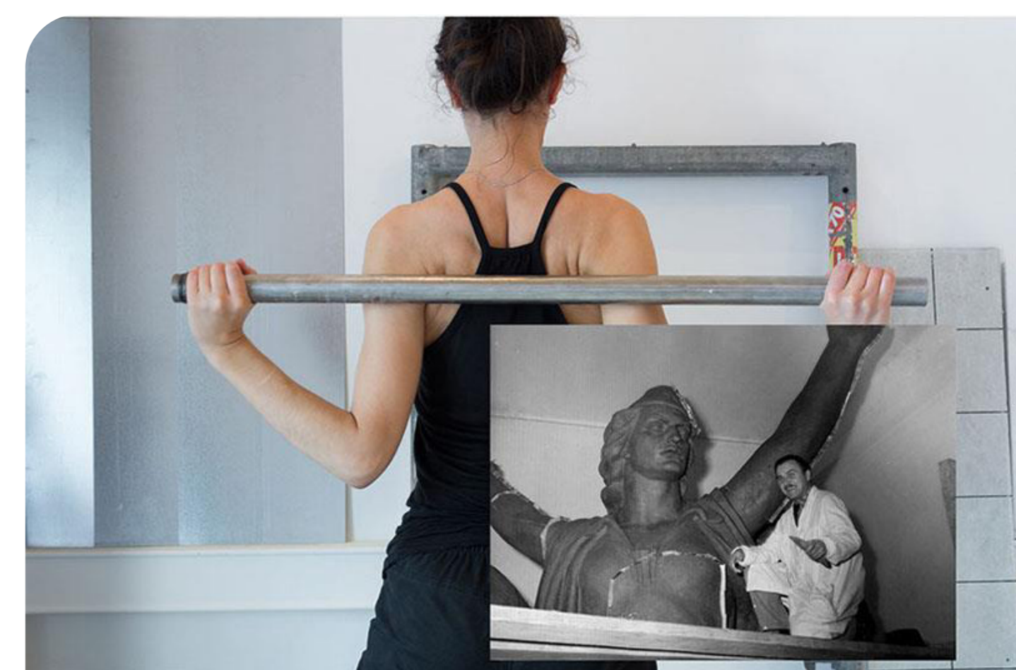
Luisa Margan, Restaging Monuments, Série de photomontages, 2014, Photographie Luisa Margan