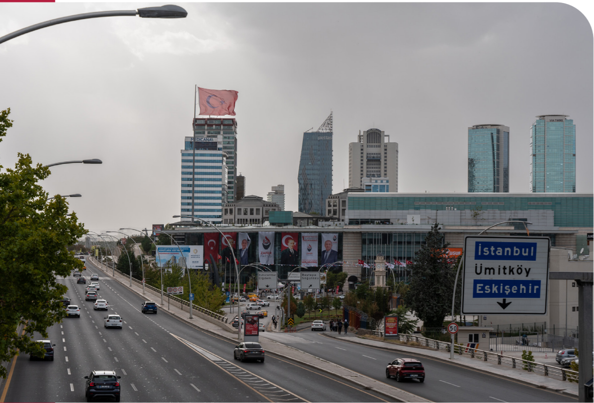
Vue du quartier d'affaire Cukurambar à Ankara

Projet ANR collaboratif de 4 ans (2022-2026) ; sigle : SPACEPOL