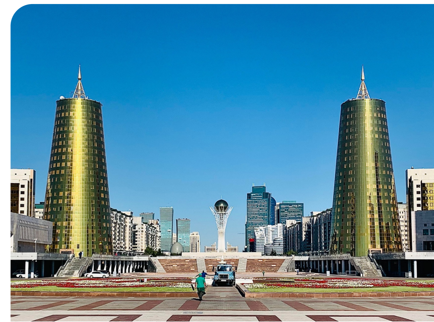
Principal axe urbain d'Astana autour duquel le pouvoir politique kazakh est organisé