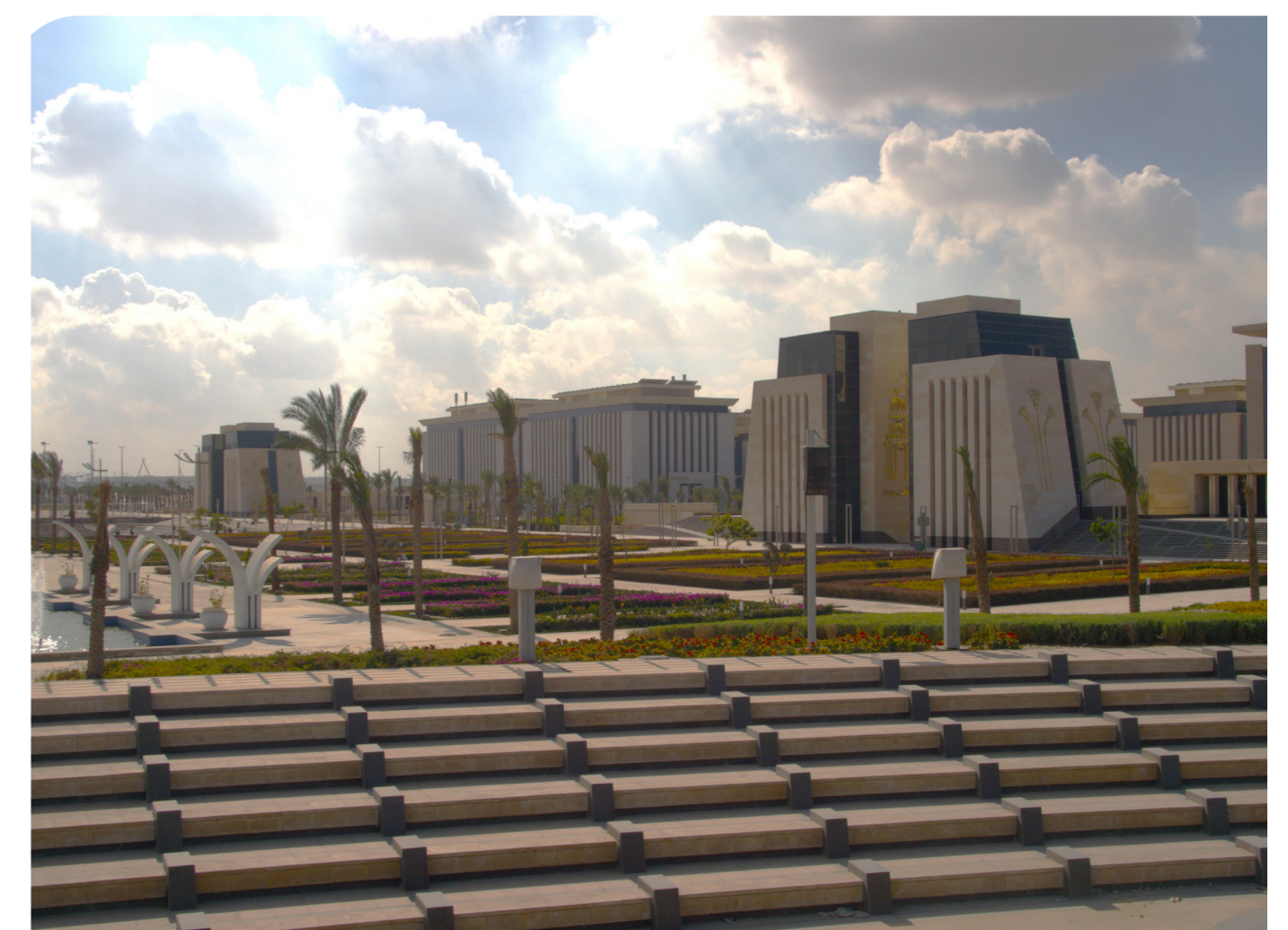
Image de la nouvelle capitale administrative au sud du Caire.