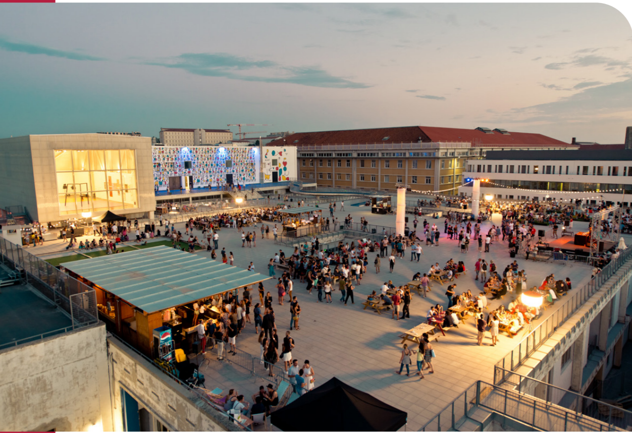
Friche de la Belle de Mai à Marseille.