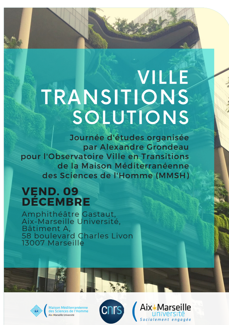
Colloque Ville, Transitions, Solutions organisé au Pharo

Réalisation de la MMSH et l'axe « Altermétropolisation, politiques publiques et aménagement » du laboratoire TELEMMe, ce SIG mobilise acteurs institutionnels et collectivités locales (métropole, ville de Marseille et d'Aix-en-Provence, agence d'urbanisme du pays d'Aix, agence d'urbanisme de l'agglomération marseillaise...), mais également collectifs citoyens et associations producteurs d'innovations sociales